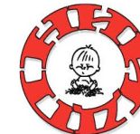
НИИ детского питания РСХА