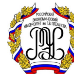
РЭУ им. Г. В. Плеханова