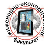
МГТУ им. Н.Э. Баумана