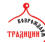
Центр Возрождения традиций