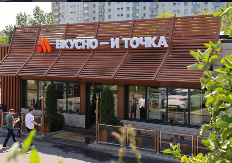
«ВКУСНО - И ТОЧКА»

ПОСТАВЛЯЕМ ОБОРУДОВАНИЕ ДЛЯ КРУПНЕЙШИХ ФАСТ-ФУД СЕТЕЙ