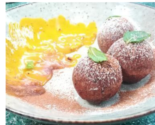
кваркини с фруктовым муссом и сиропом