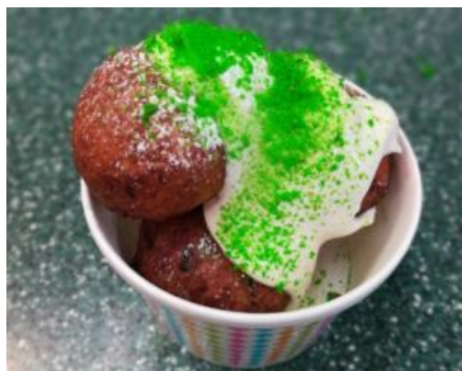
кваркини с наполнителем