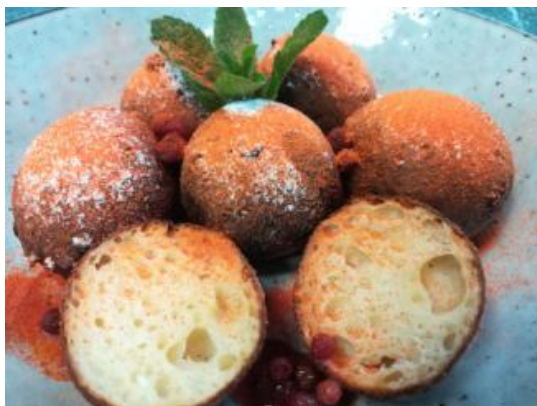
кваркини в сахарной пудре